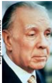
Jorge Luís BORGES

Jorge Luís BORGES, 1899-1986 (Escritor argentino)